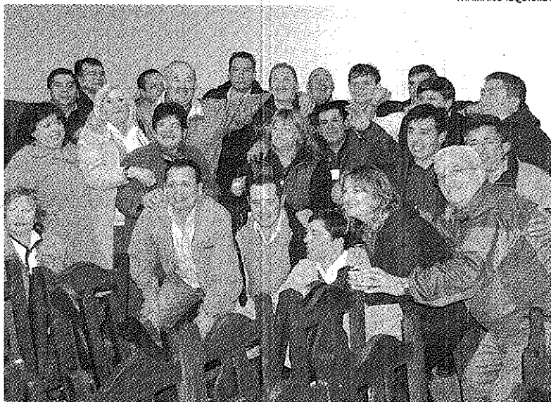
ES LA MADRUGADA DEL JUEVES Y YA SE CONOCE AL GANADOR. LA CELESTE FESTEJA.

De acuerdo al estatuto del Círculo Policial, la asamblea se inició con el tratamiento de la memoria y el balance de los dos últimos períodos, los cuales fueron aprobados por una abrumadora mayoría, aunque se escucharon voces de protesta por montos que no estarían del todo claros y que ya se han efectuado una denuncia penal. No obstante ello, los más de 615 afiliados a la mutual policial insistieron en que lo más importante era votar por la renovación de las autoridades de esa entidad y con dos horas de retraso y con un inexplicable sistema de una sola urna se procedió a la votación in-