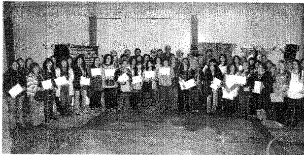
Doscientos diez docentes recibieron sus certificados en un acto que se realizó en la Escuela 43.

“La revolución tecnológica tiene que ser una de las prioridades en la educación de nuestros chicos. Para que en el futuro sean vecinos con posibilidades de insertarse en