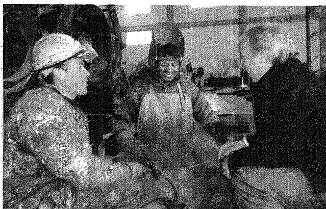
El Gobierno amplía su oferta crediticia a diversos sectores productivos, buscando fomentar la industria en Santa Cruz.

pequeñas y medianas empresas serán un factor clave.