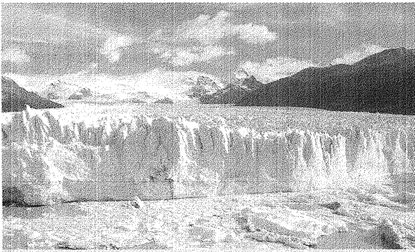
La Ley determina cuáles son las actividades prohibidas en la zona de glaciares.

El nombre completo de la ley es "Ley de presupuestos mínimos para la preservación de los glaciares y del ambiente periglacial". Su objeto según detalla en su artículo N° 1 es "establecer presupuestos mínimos para la protección de los glaciares y del ambiente periglacial con el objeto de preservarlos como reservas estratégicas de recursos hídricos para el consumo humano; para la agricultura y como proveedores de agua para la recarga de cuencas hidrográficas;