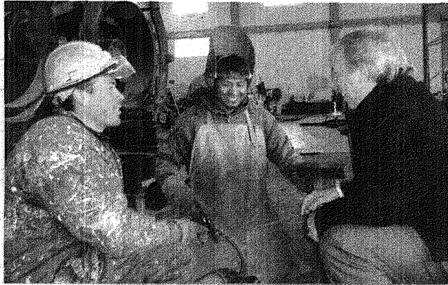
El Gobierno amplía su oferta crediticia a diversos sectores productivos, buscando fomentar la industria en Santa Cruz.

pequeñas y medianas empresas serán un factor clave.