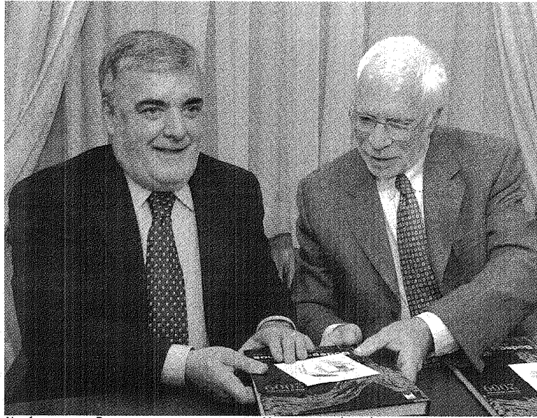
NO SÓLO ACUERDOS. DURANTE LA VISITA A LA PROVINCIA DE MENDOZA, TAMBIÉN DEJÓ FUERTES DECLARACIONES POLÍTICAS.

El gobernador lo dijo en una de las entrevistas que dio a medios de Mendoza, donde estuvo el último jueves. Además cruzó muy fuerte al ministro Amado Boudou por los 28 millones de dólares del fideicomiso que están trabados.