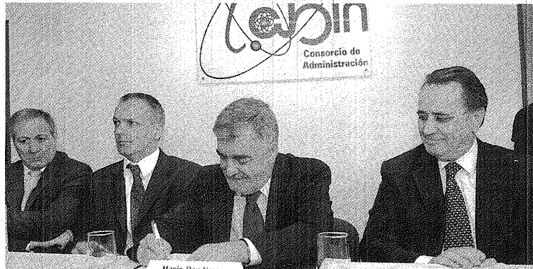
OBRAS Y POLÍTICA. EL GOBERNADOR NO DEJÓ AFUERA LA MENCIÓN DE LOS TIEMPOS ELECTORALES.

Lo dijo luego de firmar obras por 3,5 millones de pesos para mejorar casas, construir playones deportivos y un pluvial. Además llamó a seguir diseñando "una agenda ligada a las necesidades de la mayoría de la sociedad".