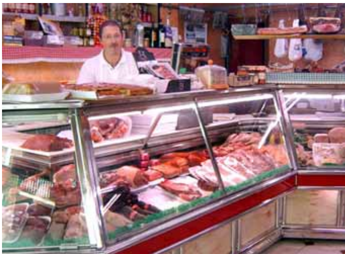
El consumo ante la disyuntiva

El precio de la carne en los mostradores aumentó hasta 75% en el año mientras que el consumo cayó 18% y en los últimos tres años el stock ganadero disminuyó en 9.400.000 cabezas. Así lo reveló el informe mensual de la Cámara de la Industria y Comercio de Carnes de la Argentina (CICCRA).