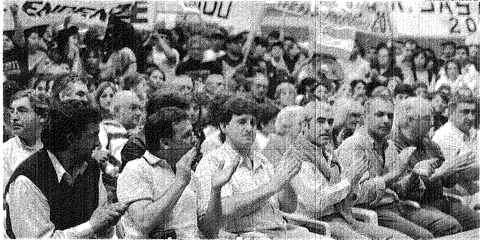
ÁVAL TODOS LOS INTENDENTES APOYARON EL FUERTE DISCURSO DEL GOBERNADOR CONTRA EL NUEVO ESPACIO PERONISTA.

Con voz ronca y con un duro contenido político, Das Neves reconoció que “nosotros mostramos con orgullo quiénes son nuestros candidatos” porque “necesitamos un Estado madrynese democrático donde la gente haga las cosas sin miedo”. En forma simultánea advirtió que “eso no es peronismo” y “nosotros venimos con un proyecto que es de la gente”.