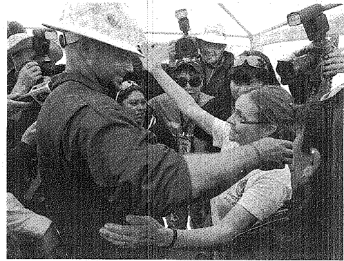
FAMILIARES DE LOS MINEROS SALUDAN A UN OPERARIO DE LA T-130.

"Hemos tenido 33 días de perforación, para rescatar a 33 mineros, pero todavía queda mucho por hacer".