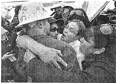
Los familiares abrazan ayer a uno de los maquinistas.

El ministro de Minería, Laurence Golborne, destacó que los mineros "están muy tranquilos", y advirtió que todavía queda bastante camino que recorrer antes del rescate. "Parece curioso que hayamos tenido que utilizar 33 días (de perforación) para rescatar a 33 mineros", reflexionó el funcionario. "Rompiamos en el nivel 622 metros", agregó sobre el