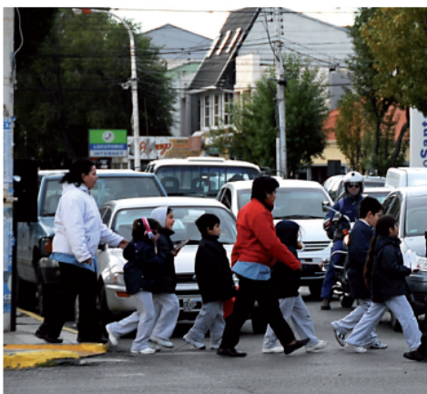
En toda la provincia habrá 5 mil censistas.

D entro de 15 días se realizará en todo el país el Censo 2010. En Santa Cruz, cerca de 5 mil censistas visitarán el 27 de octubre cada uno de los domicilios para