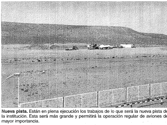
Nueva pista. Están en plena ejecución los trabajos de lo que será la nueva pista de la institución. Esta será más grande y permitirá la operación regular de aviones de mayor importancia.

tenía que ver con formar a los chicos en un sano ambiente aeronáutico, para promover el sentido de pertenencia del club y que luego pasen a formar parte de la escuela de vuelo. Lo cumplimos y prueba de ello es que hoy hay tres pilotos que se iniciaron en la Escuela de Aeromodelismo, lo que confirma además que el aeroclub es cuna de muy buenos pilotos", concluyó.