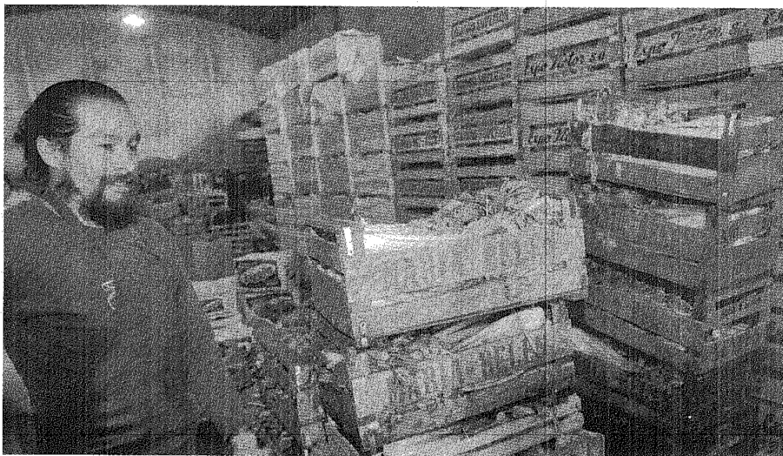
CAJAS. LAS VERDURAS SE DISPARARON EN POCOS DÍAS. DICEN LOS GRANDES COMERCIOS QUE PUEDE BAJAR EN SEMANAS.