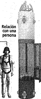
Relación con una persona

El casco contiene un micrófono y un audífono.