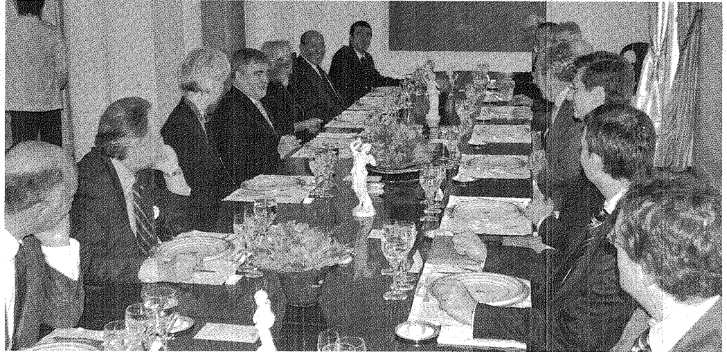
COMIÓ RICO. DAS NEVES COMPARTIÓ UN ALMUERZO CON LOS EMBAJADORES Y HABLARON DE LAS PROYECCIONES PARA LA REGIÓN. HUBO ACEPTACIÓN DE LOS DIPLOMÁTICOS.

El gobernador dijo que la visita del funcionario es una "vergüenza". Y agregó: "Es un acto de caradurismo total". Le recomendó que "traiga la plata que nos robaron" desde la administración kirchnerista. Quiere que otros reclamen.