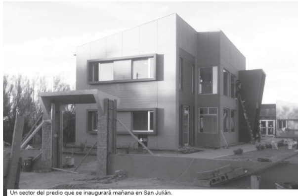
Un sector del predio que se inaugurará mañana en San Julián.

En este predio funcionará la oficina sindi-