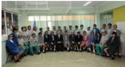
Foto publicado por la oficina de prensa presidencial del presidente chileno Sebastián Piñera (primera fila, traje oscuro) posando con los 33 mineros rescatados de las profundidades de la mina San José, en el hospital de Copiapó.

Los 33 mineros "evolucionan bien" en el hospital de Copiapó (norte de Chile), donde fueron internados tras su rescate, y al menos tres podrían ser dados de alta este jueves, señaló el ministro de Salud chileno, Jaime Mañalich, aunque uno de ellos sufre "neumonía aguda".