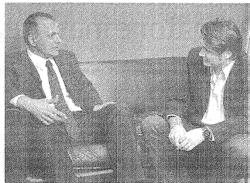
BUZZI CONFIRMÓ QUE EL PREDIO FERIAL SERÁ INAUGURADO EN DICIEMBRE.

Esto genera un importante impacto económico, a través de la generación de puestos de trabajo y de la demanda de insumos y servicios de otros sectores de la economía local. #