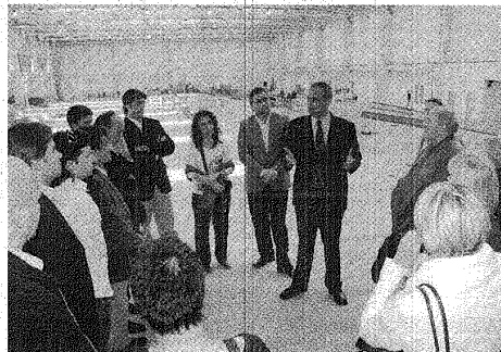
UN TOTAL DE 20 PERSONAS HARÁN UN RECONOCIMIENTO DE LOS SERVICIOS.

En tal sentido, manifestó que "este camino emprendido por el municipio resulta fundamental para posteriormente generar otro tipo de actividades que posicionen a una ciudad cuya imagen externa es la de extracción de energía y gas, como una ciudad generadora de eventos, tiempo de ocio y esparcimiento".#