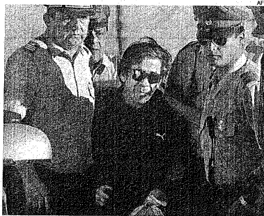
■ La policía escoltó a los mineros tras salir del hospital.