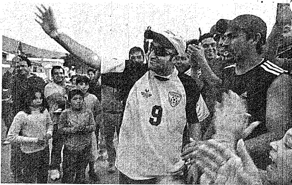
■ Al regresar a sus casas de Chile, los mineros fueron recibidos por familiares y vecinos.

"Poco a poco nos fuimos organizando, y sentíamos el apoyo de afuera. Ya cerca del final, lo único que queríamos era salir", contó poco antes de llegar a su vivienda. Ya en tono de reflexión afirmó: "Teníamos que pasar algo así para mostrar cómo trabajan los mineros". ■