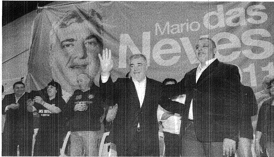
UN PASO IMPORTANTE. EL GOBERNADOR, AYER EN ÁVELLANEDA, DONDE ENCABEZÓ UN ACTO POR EL DÍA DE LA LEALTAD QUE REUNIÓ A UNAS TRES MIL PERSONAS.

dad que encabeza el mandatario en distintos lugares del país, en el contexto de la gira que comenzó hace tiempo y que tiene cada vez más trascendencia. No es casualidad que el secretario de Trabajo sea quien suele anteceder en la palabra al gobernador en cada acto o encuentro que realiza fuera de Chubut. Su figura no es decorativa y tampoco pretende arrogarse un lugar que no le corresponde.