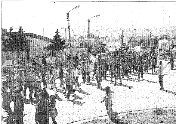
Distintas generaciones, desde niñas a abuelas participaron en la nueva edición de la Corrida de la Mujer.

1°) Ayala-Carbajal 26' 45" 2°) Catalán-Catalán 26' 54" 3°) Vargas-Fernández 28' 16" 4°) Maldonado-Martínez 29' 04" 5°) Enriquez-Herrera 32' 09" 6°) Ayala-Ayala 32' 59" 7°) Avila-Cofré 34' 20" 8°) Amado-Villata 36' 28"