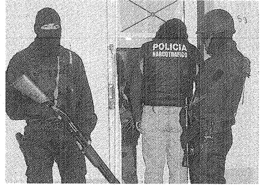
A FULL LOS UNIFORMADOS DETECTAN DROGA CADA VEZ MÁS SEGUIDO EN 2010.

En cuanto a la distribución geográfica de los procedimientos antinarcóticos este año, de nuevo puntea Esquel, donde hubo 50 operativos, el 40 por ciento de los 126 trabajos policiales que hubo en total. En esa ciudad cordillerana, 48 de los operativos fueron in fraganti. Una curiosidad en Co-