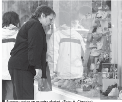
Buenas ventas en nuestra ciudad.

Incremento - Seguidamente, Rodríguez señaló “en términos numéricos se ha producido un incremento de un 20%, pero es necesario remarcar que esto es en pesos”, es decir, tomando el valor de los productos. “Pero también debemos indicar que la venta en cuanto a unidades tuvo