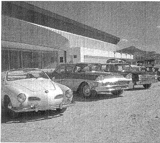
El Club de Autos Clásicos, fue invitado a recorrer las obras del Centro Cultural.