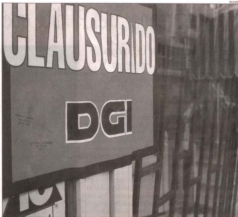
Los operativos de AFIP-DGI siguen adelante en la región, en la búsqueda de una red de distribución de mercadería contrabandeada.

En este punto, se detectó en el caso del local de informática una deuda de 10 meses en el pago del monotributo.