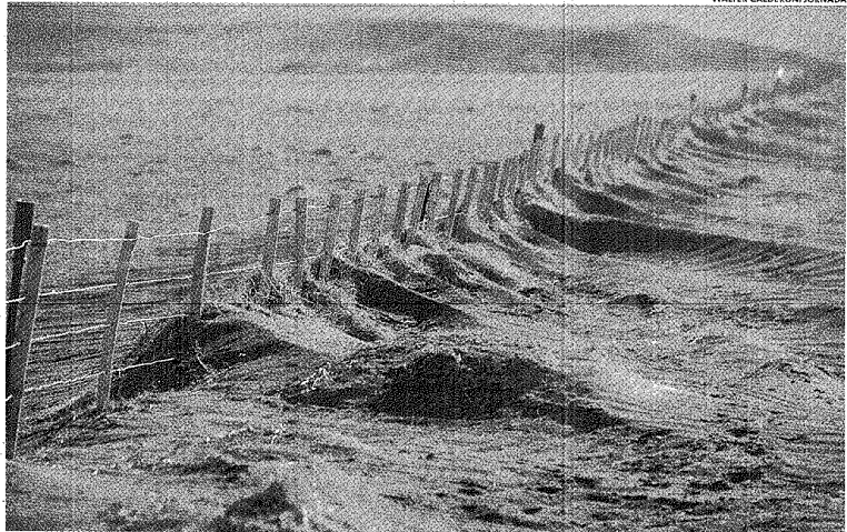
DESOLACIÓN. LA SEQUÍA CAUSA LA ACUMULACIÓN DE POLVO IMPRODUCTIVO QUE HACE TEMBLAR A LOS PRODUCTORES.

Insistió con que no le cayó bien la forma en que arribaron a Esquel los funcionarios nacionales, y comentó que aquella vez debieron salir a buscar productores porque no tenían a quiénes darles los subsidios. Aseguró que se lo contaron por teléfono varias personas a las que les sugirió que recibieran los aportes pero que traten de cobrarlos antes de marzo. Además, señaló que a Williams nunca lo escuchó hablar del problema del campo ni mantiene reuniones con el sector. "Si expresan el pensamiento kirchnerista, que expliquen a los productores la política a aplicar en los próximos años", subrayó.#