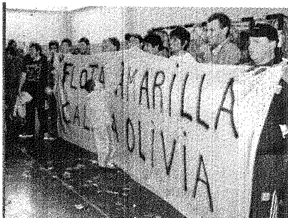
Los marineros de la Flota Amarilla denunciaron que los dueños de los barcos no cumplieron con un acuerdo.