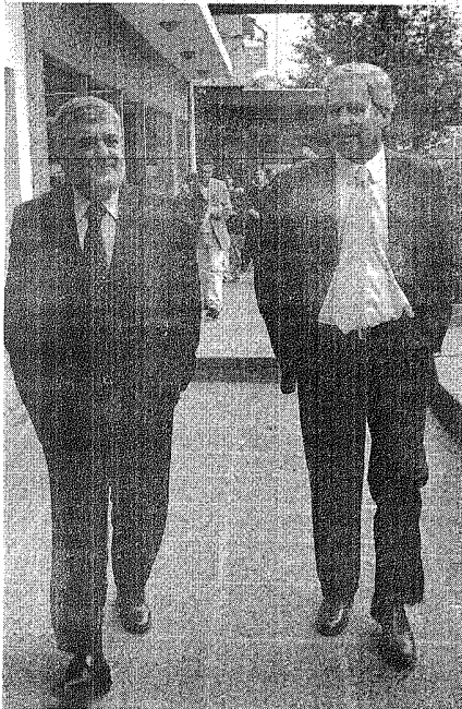
Los dos referentes del Peronismo Federal ayer caminaron las calles de Bariloche.

Cabe destacar que las obras en la localidad abarcan a las calles Benito Fernández, Dromaz y Balbín.