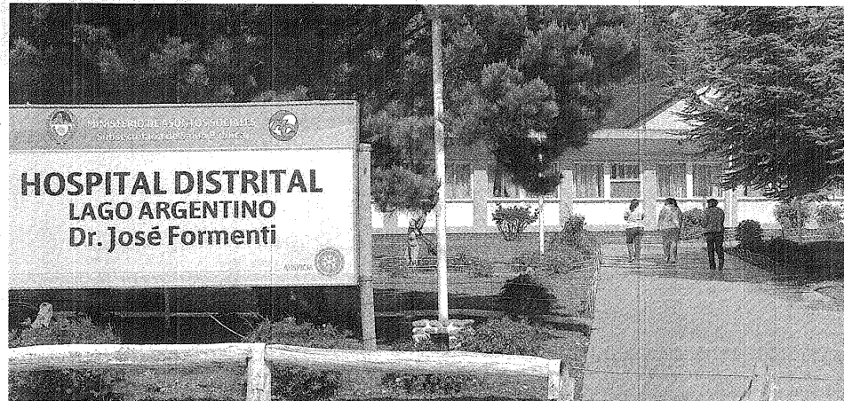
EL ÚLTIMO INTENTO. LA ENTRADA AL HOSPITAL DONDE KIRCHNER INGRESÓ SIN SIGNOS VITALES Y FALLECIÓ Pese a los desesperados intentos por salvar su vida.

Comoción nacional: el ex Presidente murió en El Calafate por un paro cardíaco. Tras 40 minutos de intentos, no pudieron reanimarlo. Cristina lo despidió en una ceremonia íntima. Tras el velorio será enterrado en Río Gallegos.