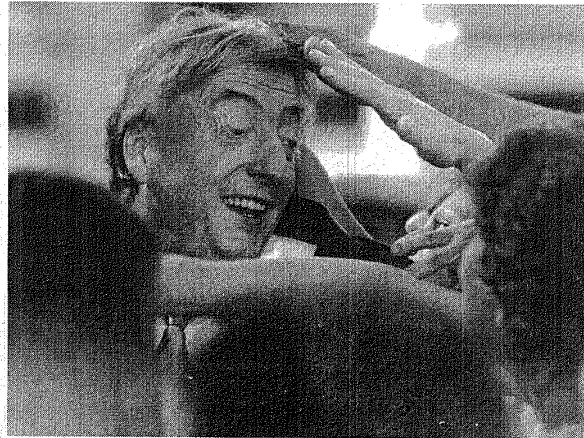
Cada vez que estuvo en Chubut, Néstor Kirchner recibió múltiples muestras de afecto.

“Acá hay un pueblo cerca de la cordillera que se llama Tecka, donde viven algunas miles de almas que hace muchos años luchan por ser y que hoy venimos