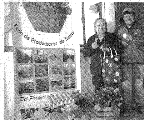
SIMILAR. LA FERIA DE PRODUCTORES EN LA RURAL.