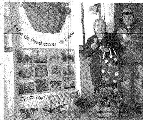
SIMILAR. LA FERIA DE PRODUCTORES EN LA RURAL.