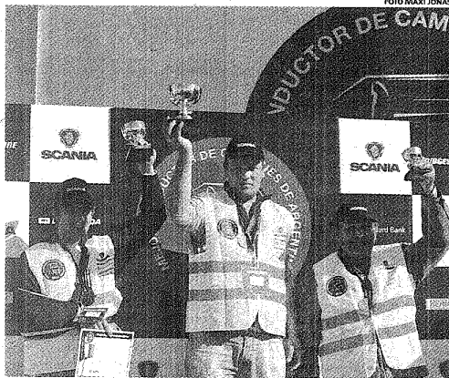
EN ARGENTINA, MÁS DE 3.300 CAMIONEROS PROFESIONALES SE INSCRIBIERON.

de conducción de transporte pesado más importante desarrollada por Scania a nivel mundial. La competencia que reúne a conductores de todo el país, sin importar la marca de vehícu-