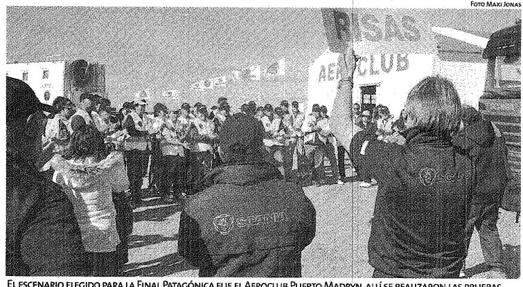
EL ESCENARIO ELEGIDO PARA LA FINAL PATAGÓNICA FUE EL AEROCUBO PUERTO MADRYN, ALLÍ SE REALIZARON LAS PRUEBAS.

Scania es uno de los líderes mundiales en la fabricación de camiones y ómnibus para transportes pesados, y de motores y durante el año 2008 sus ingresos alcanzaron 8,1 mil millones de Euros.#