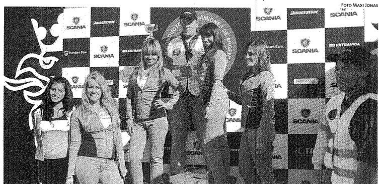
LA FINAL PATAGÓNICA FUE PROTAGONIZADA POR 32 CAMIONEROS, ELEGIDOS ENTRE 100 PARTICIPANTES DE LA REGIÓN.