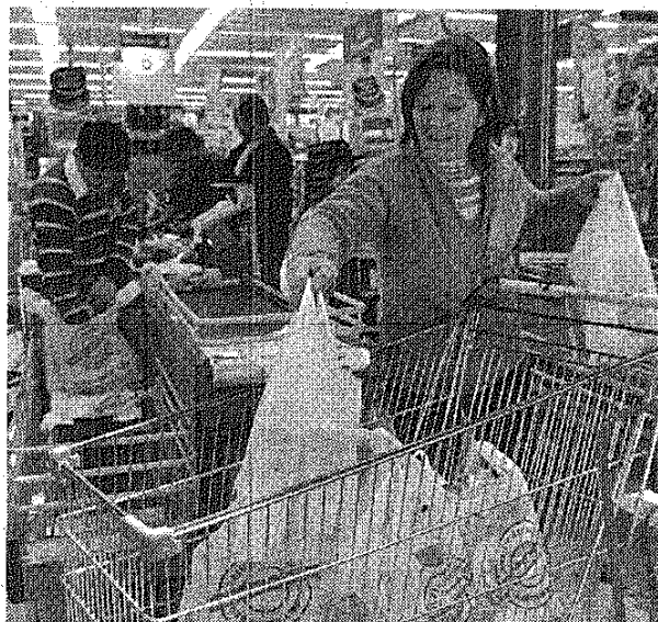
■ Los supermercados aumentan sus ventas con promociones.

También es setiembre, la medición a precios corrientes con estacionalidad