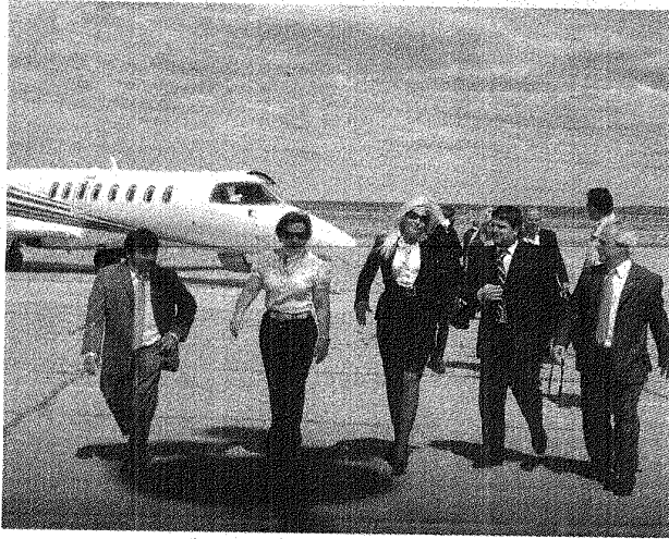
En el aeropuerto de Trelew, Susana Giménez fue recibida por la esposa del gobernador.

Al inaugurar el Centro de Interpretación que permitirá en Punta Tombo la colonia de pingüinos de Magallanes más grande del mundo, potenciar la protección de aves que en temporada alta llegan al millón, el gobernador Mario Das Neves instó a imitar el ejemplo dado por los voluntarios que recientemente permitieron la sanación de ejemplares que habían aparecido con manchas de petróleo.