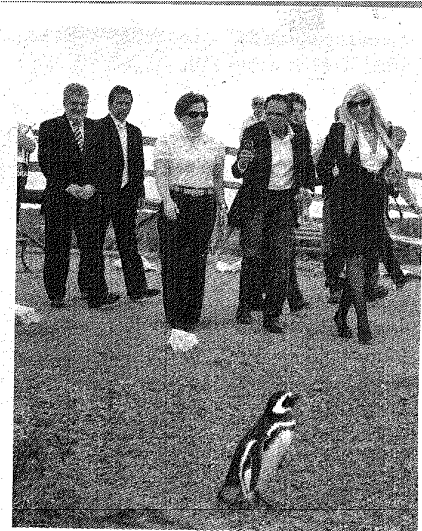
La diva de los teléfonos no se quitó los tacos para recorrer Punta Tombo.