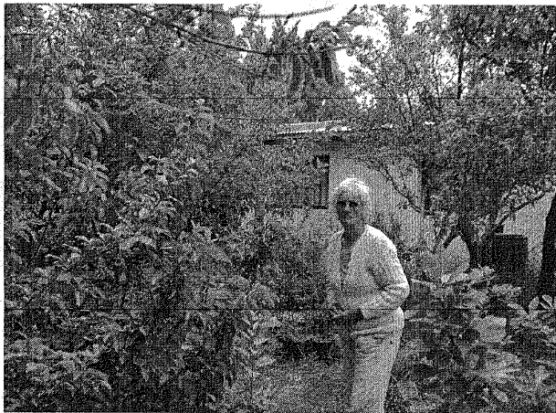
La mujer reside en el sector desde hace 15 años.