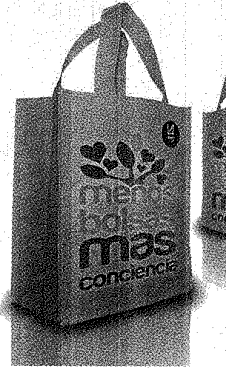
LA ANÓNIMA LANZÓ NUEVA PROMOCIÓN.

Esta es la segunda propuesta ambiental de La Anónima en la que Fundación Patagonia Natural participa. La anterior se vincula a la edición de