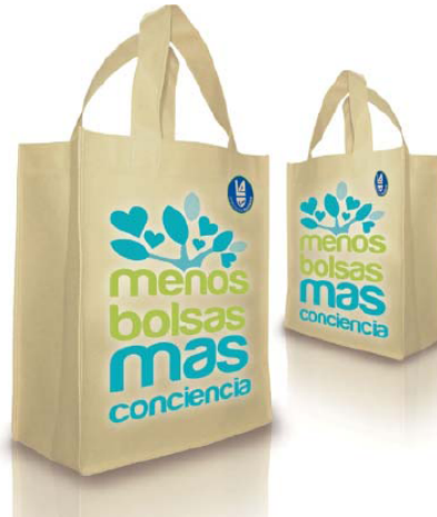
La iniciativa cuenta con el aval de la cadena de Supermercados La Anónima y la Fundación Patagonia Natural.

En esta campaña "Menos bolsas, más conciencia", también se sumó la compañía Protect & Gamble a través de su línea de productos (Pampers, Ariel, Ace, Pantene, Gillette, Magistral, Head & Shoulders y Oral-B). Esta compañía colaborará en las campañas de conservación y protección de la biodiversidad que lleva adelante la FPN.