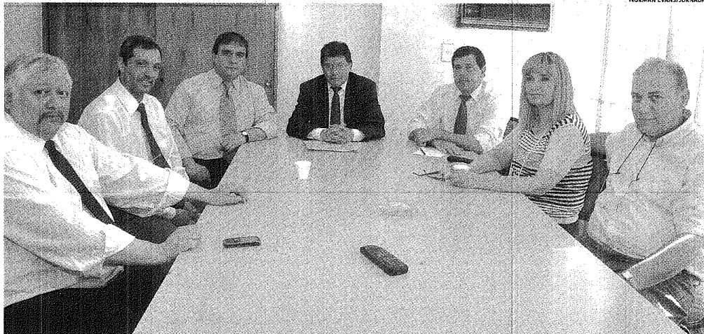
LA CÚPULA. LOS POPES DE LA ASOCIACIÓN BANCARIA BRINDARON MÁS DETALLES PARA ALIMENTAR UNA DENUNCIA QUE REBOTÓ FUERTE EN LA OPINIÓN PÚBLICA.