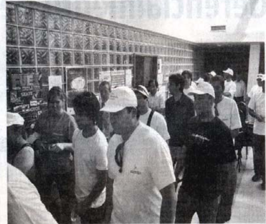
AFILIADOS DEL CENTRO DE EMPLEADOS DE COMERCIO PRESENTES EN EL DELIBERANTE.

"El proyecto surge de la necesidad de preservar y consolidar espacios verdes ante el incesante crecimiento demográfico de la ciudad porque constituyen ámbitos en los que los vecinos se congregan con fines de esparcimiento, actos públicos, actividades deportivas o culturales, por lo que su recuperación es una necesidad vital de la comunidad", concluyó el concejal Bermúdez.