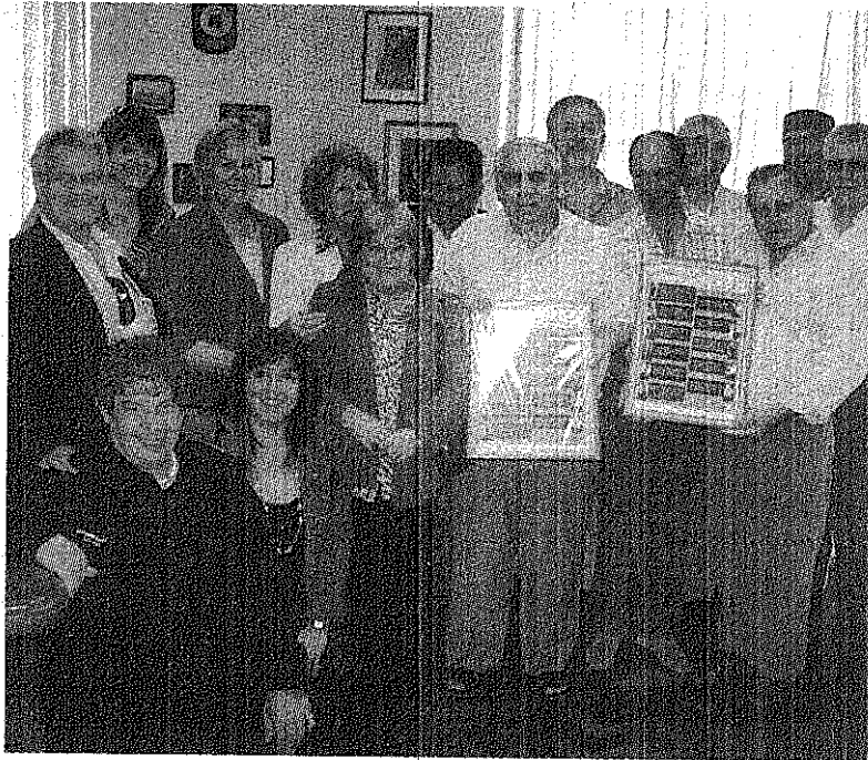
PARA LA FOTO. EL INTENDENTE DE DE CAMARONES, CON TODOS LOS VISITANTES.