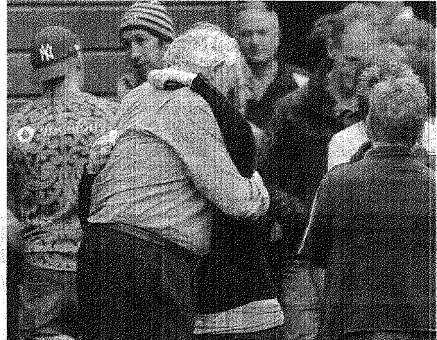
FAMILIARES DE LOS MINEROS FUERON TRASLADADOS AYER A LAS INSTALACIONES.

Probablemente, los 29 mineros se encuentran atrapados en un túnel a solo 150 metros de la superficie, pero