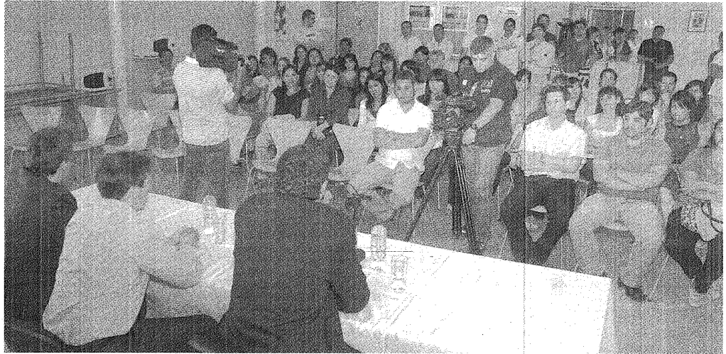
TODOS ADENTRO. DE AQUÍ HASTA MARZO, MÁS DE 330 BECADOS PASARÁN A FORMAR PARTE DE LA PLANTA TRANSITORIA DEL ESTADO CHUBUTENSE, SEGÚN SE CONFIRMÓ.

Serán sumas por única vez que se pagarán a fin de año. El gobierno también anunció que 295 trabajadores becados del Ministerio de la Familia pasarán a planta transitoria. En marzo se absorberá a otros 130 agentes en esa condición laboral.