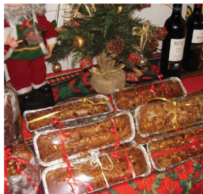
El acuerdo espera incluir las cadenas de supermercados.