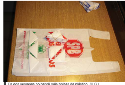
En dos semanas no habrá más bolsas de plástico. (H.C.)

domo”. Asimismo, especificó “en Buenos Aires hubo un recambio de bolsas, los comercios no quitaron la totalidad de las bolsas, sino que las cambiaron”.