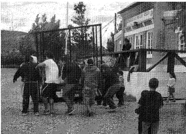
En las instalaciones que posee el "Coirón" en Astra, los trabajos no cesan.

D irigentes y allegados de Comodoro Rugby Club, se encuentran trabajando arduamente de cara a la presentación del 1er Nine Solidario Nocturno, que tendrá lugar este