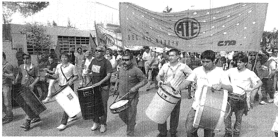
POR LAS CALLES DE RAWSON. LOS GREMIALISTAS ESTATALES SE MOVILIZARON PARA RECLAMAR. EL GOBIERNO HABLÓ DE "JUGADAS POLÍTICAS" Y PIDIÓ QUE SE DEFINAN.

Das Neves dijo que si la oferta no se acepta, se puede discutir de cero pero pidió que se apuren en definir una postura porque ya llega diciembre. Y aseguró que hay sindicalistas a los que quejarse así "les tendría que dar vergüenza".