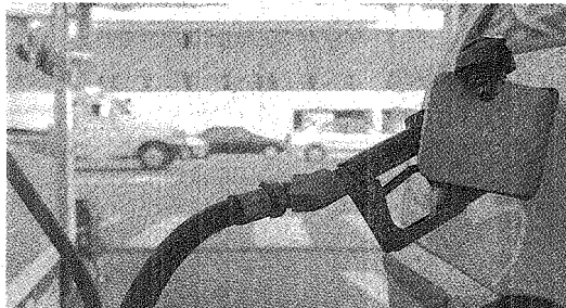
LOS PLAYEROS AMENAZAN CON NO CARGAR COMBUSTIBLE EN FIN DE AÑO.

Los trabajadores de estaciones de servicio realizarán asambleas permanentes en las bocas de expendio de YPF y del Automóvil Club Argentino durante las fiestas de fin de año, lo cual podría afectar la carga de combustible, anunció ayer el gremio.