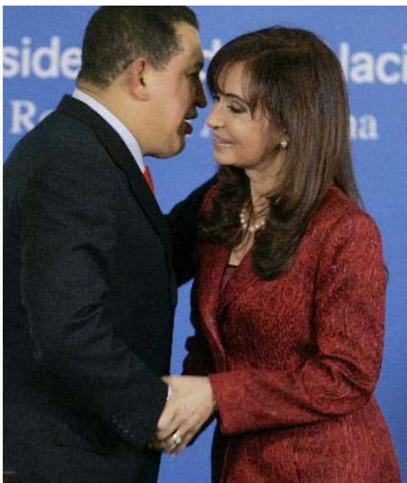
Cristina y Chávez eran mirados con recelo en el 2009.