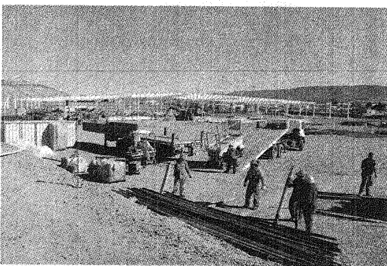
Mientras tanto, los trabajos en el predio del club Portugués continúan adelante.