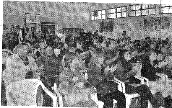
Los asistentes al plenario definieron sus prioridades para Comodoro.

Cada una de estas comisiones desarrolló sus contenidos de acuerdo a los planteos que hizo público cada vecino presente y estos a su vez fueron luego debatidos para integrar las conclusiones