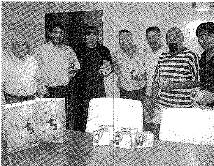
LOS 10 TELÉFONOS QUE ESTARÁN EN LAS CASETAS DE LA COSTA DE PLAYA UNIÓN.

L a Cooperativa de Servicios Públicos de Rawson entregó diez teléfonos a los integrantes de la Asociación de Guardavidas Rawson que ayer recibieron por parte del gobierno provincial su personería jurídica. Ante el aporte que hacen los 50 guardavidas durante toda la temporada para salvar vidas en la costa de Playa Unión, la entidad decidió donarle los aparatos con las líneas para que puedan comunicarse gratuitamente.