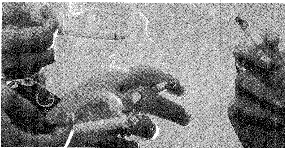
UN PLACER SENSUAL. LA NORMA ES MUY DURA CON LOS MÁS VICIOSOS Y DE PASO IMPULSA UN AMPLIO ABANICO DE ACCIONES PARA LIBERAR A CHUBUT DEL HUMO.

Será para los responsables de locales donde la norma no se respete. Dicen que nuestra provincia está segunda en el ranking nacional de adolescentes fumadores. Sólo se salvan los presos y los pacientes de centros de salud mental.